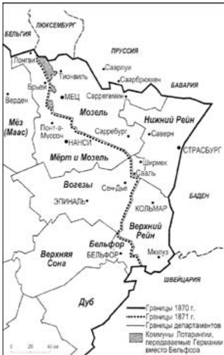
Изменение границы между Францией и Германией по Франкфуртскому договору

10 мая 1871 года в 14.15 в той же гостинице « Zum Schwan » был подписан окончательный мирный договор между Францией и Германией. Договор подписали: со стороны Франции – Фавр, Пуйе-Кертье и Гулар, с немецкой стороны – Бисмарк и Арним.